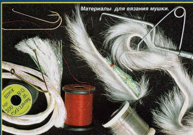
Материалы для вязания мушки.