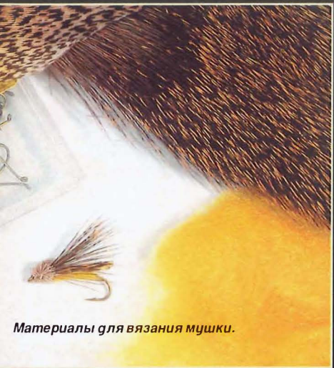
Материалы для вязания мушки.

6 Уведите торчащие вперед кончики меха назад и сделайте перед ним несколько оборотов монтажной нитью. Закрепите монтажную нить, отрежьте лишнее и покройте узел лаком.