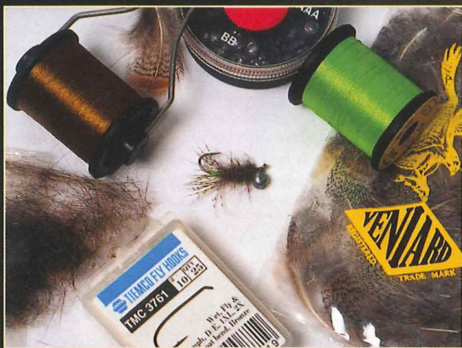
Материалы для вязания мушки “The Leadhead”.