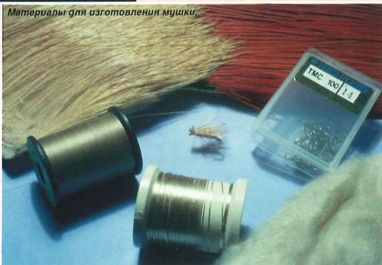
Материалы для изготовления мушки.

7 Намотайте головку, при помощи узелвяза закрепите монтажную нить. Отстригите лишнее и примотайте в пучок волосы вверх. Чтобы они не мешали, нанесите на головку лак. После того как лак высохнет, левой рукой приподнимите толстую часть пучка и, держа пальцы параллельно верхнему краю крыла, отстригите приподнятый волос таким образом, чтобы остались примерно 2-миллиметровые кончики.