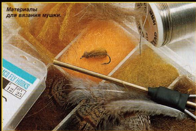
Материалы для вязания мушки.