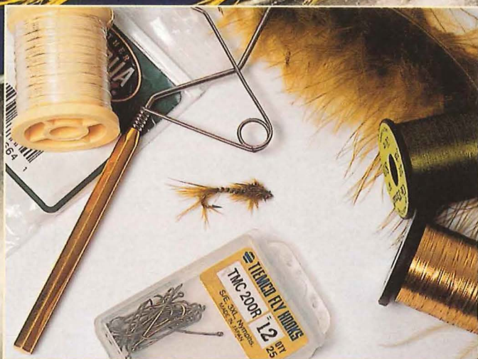
Материалы для вязания мушки "Marabou Damsel Nymph".

Мушка "Marabou Damsel Nymph" имитирует личинку стрекозы подотряда Zygoptera. В Подмосковье этих стрекоз называют "стрелки" или "красавки". Они отличаются от других тем, что во время отдыха складывают крылья вдоль спины.